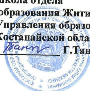
График организации питания в школьной столовой 1-4 классов КГУ «Пригородная общеобразовательная школа» на 2024-2025 учебный год